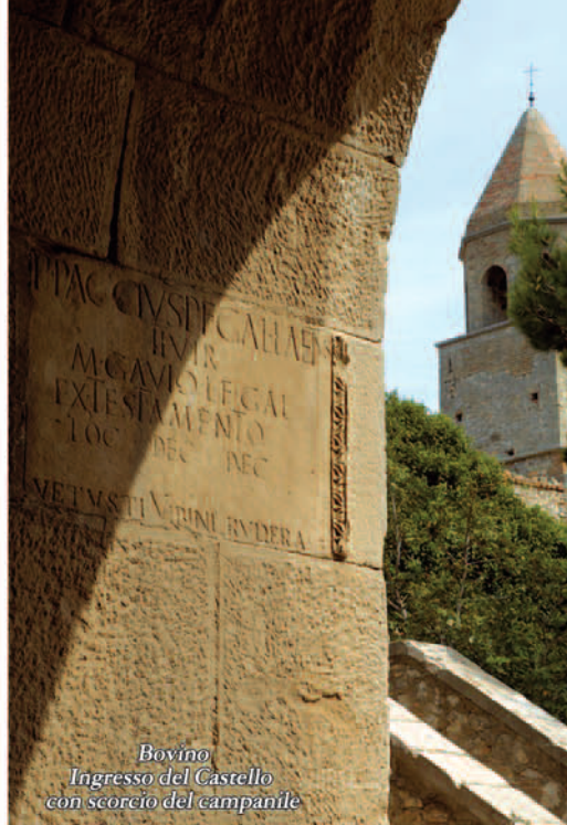
Bovino Ingresso del Castello con scorcio del campanile

A Bovino: il centro storico, la Cattedrale, il Museo Civico e il Museo diocesano, il Santuario di Valleverde.