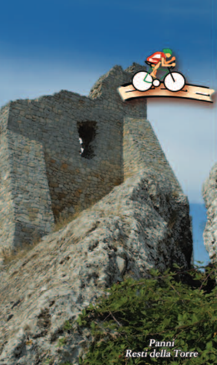
Panni Resti della Torre